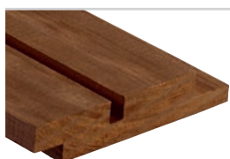
D-fals60° m/spor Kebony Clear 19 x 120 mm