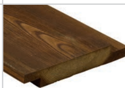
D-fals90° Kebony Character 21 x 148 mm