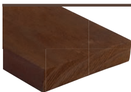
Rektangulær Kebony Clear 19 x 110 mm