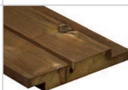
D-fals90° m/spor Kebony Character 21 x 148 mm