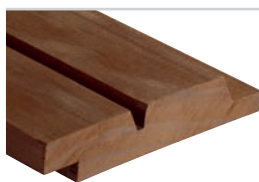
D-fals60° m/spor Kebony Clear 19 x 120 mm