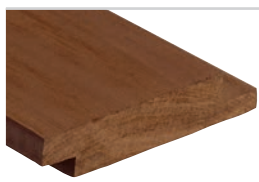
D-fals90° Kebony Clear 19 x 120 mm