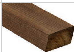
Rhombus Kebony Character 29 x 59 mm