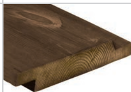
D-fals60° Kebony Character 21 x 148 mm