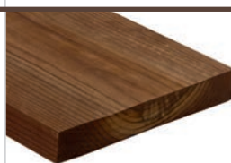
Rektangulær Kebony Character 21 x 148 mm