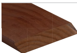
Rhombus Kebony Clear 19 x 120 mm