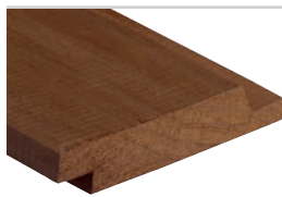
D-fals60° Kebony Clear 19 x 120 mm